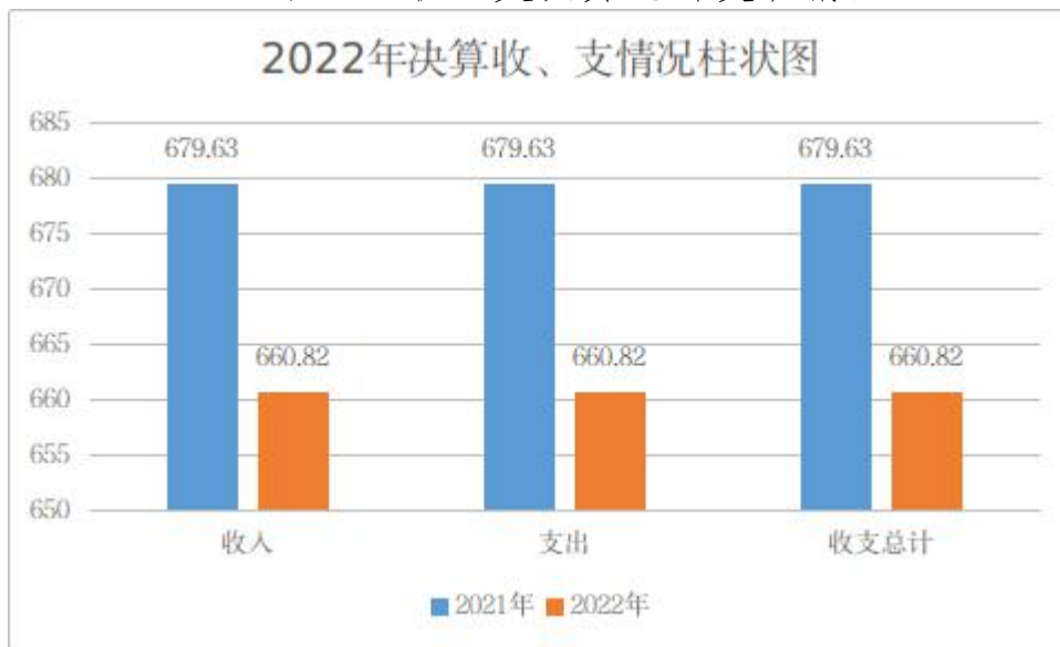
图 1: 收、支决算总计变动情况

2022 年度收、支总计均为 660.82 万元。与 2021 年度相比，收、支总计各减少 18.81 万元，下降 2.77 %，主要原因是本年人员经费较上年增加 9.92 万元，项目支出较上年减少 29.21 万元。